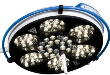
IGNIS 160F IGNIS 160FA